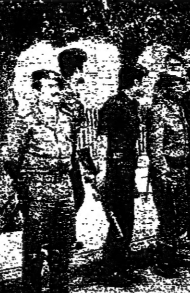
مجموعة من رجال الامن ترصد نشاط القاصية في بيروت

لمتحت الحوادث امس الى منطقة جبل النيب، ثم انفجرت مجددا في الشمال بين زغرنا والفسنية فيما كانت الحكومة تحاول تنفيذ التدابير الأمنية التي اتخذتها في بيروت والفواحي. وقد أكد الرئيس رشيد كرامي ان تدابير امن مستقلة اخذت لتأمين وقف اطلاق النار في المناطق كما أكد الرئيس كميل شمعون بمناسبة تراس اجتماعا للجنة الضيق العليا اللبنانية - الفلسطينية ان قوى الامن ستسلم الحواجز في الشمال، وانها ستسلم الحواجز من المسلحين اما اذا رفضوا ذلك فستزال العواجز بالقوة. وقد اجتمع الرئيس سليمان تروني والرئيس كميل شمعون في قصر الجمهوري مساء امس وجرى اتصال مع الرئيس رشيد كرامي بخصوص معالجة حوادث الشمال، والاجراءات الأمنية التي اتخذت في جبل النيب، كما